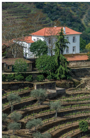
VINHA DOS CARDENHOS

Extraordinário perfume de flor de laranjeira e esteva, com notas de caruma e bergamota em pano de fundo. O paladar é opulento e sedutor, revelando concentração hipnotizante e intensidade incrível, sem destronar a notável estrutura e equilíbrio do vinho. Excelente acidez proporciona um recorte de singular frescura que espelha bem as exposições mais resguardadas das parcelas em socalco Stone Terraces dos Malvedos. Ao provar este vinho, a primeira palavra que nos vem à mente é: inacreditável.