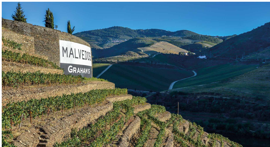
UMA DAS PARCELAS DA VINHA "PORT ARTHUR"

Dado os seus elevadíssimos custos de construção e de manutenção, os socalcos são hoje em dia um fenómeno relativamente raro no Douro. Estes muros de xisto que servem de suporte aos terraços das vinhas, têm uma capacidade única de conservar durante o período noturno o calor diurno gerado pelos raios solares, beneficiando a fase final das maturações.