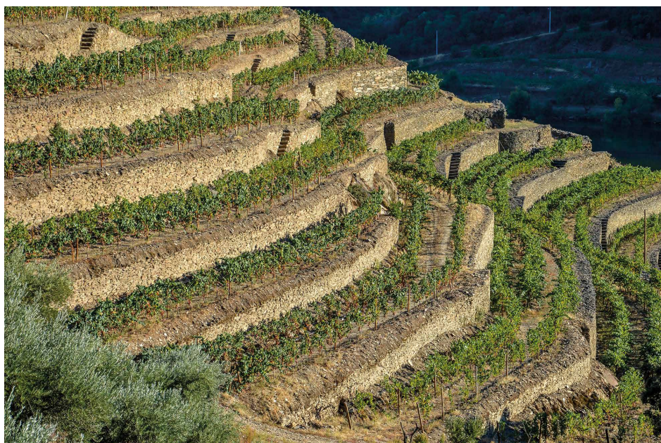
OS "STONE TERRACES" NA QUINTA DOS MALVEDOS