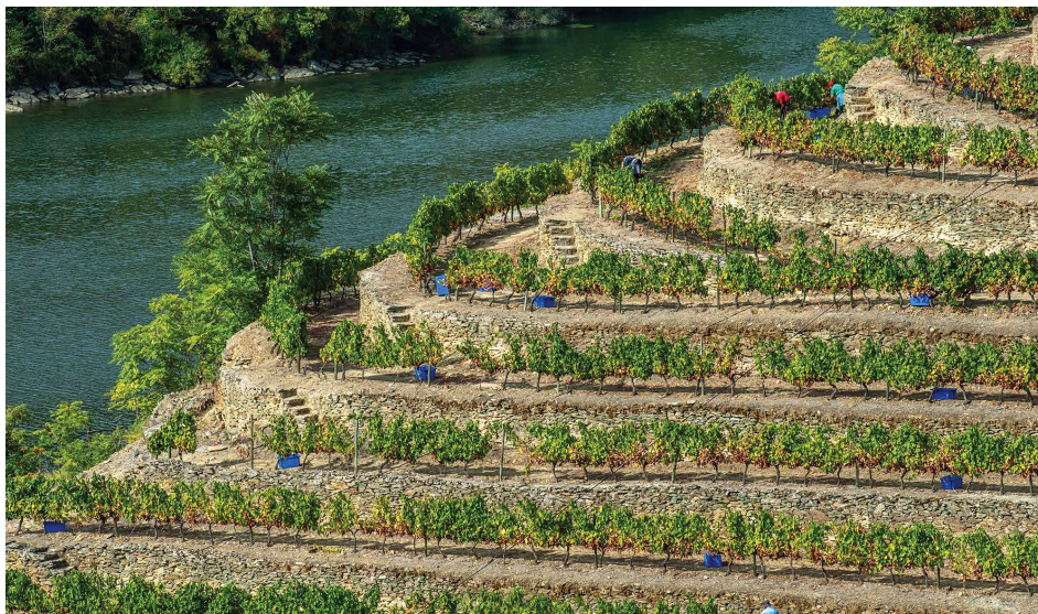
OS MUROS DE PEDRA DA PARCELA 43 DA VINHA "PORT ARTHUR"