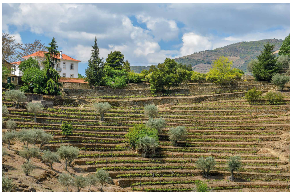
A VINHA DOS CARDENHOS, QUINTA DOS MALVEDOS

A parcela dos Cardenhos , em forma de anfiteatro por detrás da casa, tem uma exposição noroeste e a parcela Port Arthur , que circunda a cumeada sobre a qual a casa assenta, está orientada a nascente. Estas exposições contrastam completamente com a orientação predominante – a sul – de grande parte da vinha dos Malvedos. Estas exposições mais frescas revelaram as suas vantagens num ano